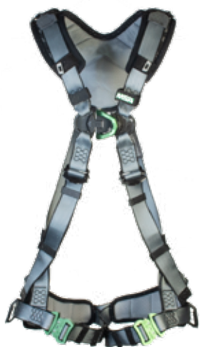
V FIT ryggb/bröst-D-ring (art.nr 10206534)