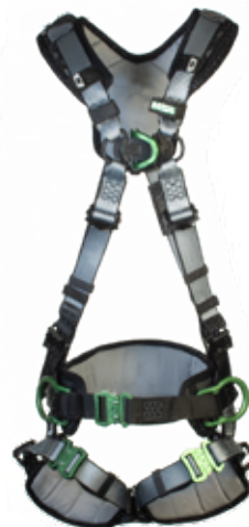
V-FIT ryggb/bröst/höft-D-ring med midjebälte (art.nr 10206546)